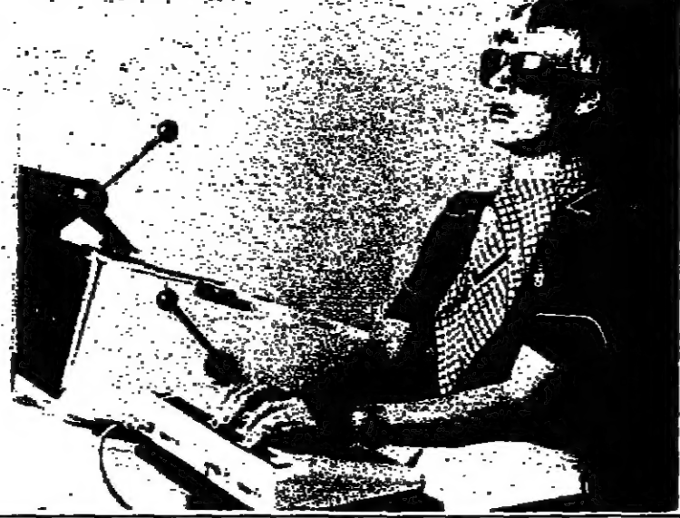
Portrait of a man, likely the author or a key figure mentioned in the text.

وقد كانت إيطاليا على رأس حركة التحرر الفكري ، وبكونها المسببة في ضرب النظام الاقطاعي . حيث ولدت إيطاليا في غسارنتف فني لا يمكن الشك به ، ففي إيطاليا - وبشكل خاص في فلورنسا وميلانو والديتان الاكثرتطورا من الناحية الصناعية كان قد نتج الفكر .